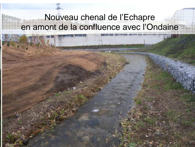
Nouveau chenal de l'Echagre en amont de la confluence avec l'Ondaine