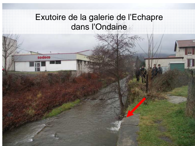
Exutoire de la galerie de l'Echagre dans l'Ondaine