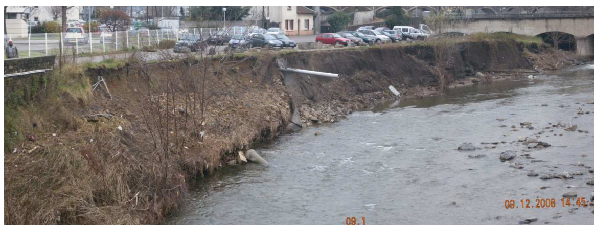
Erosion avant travaux